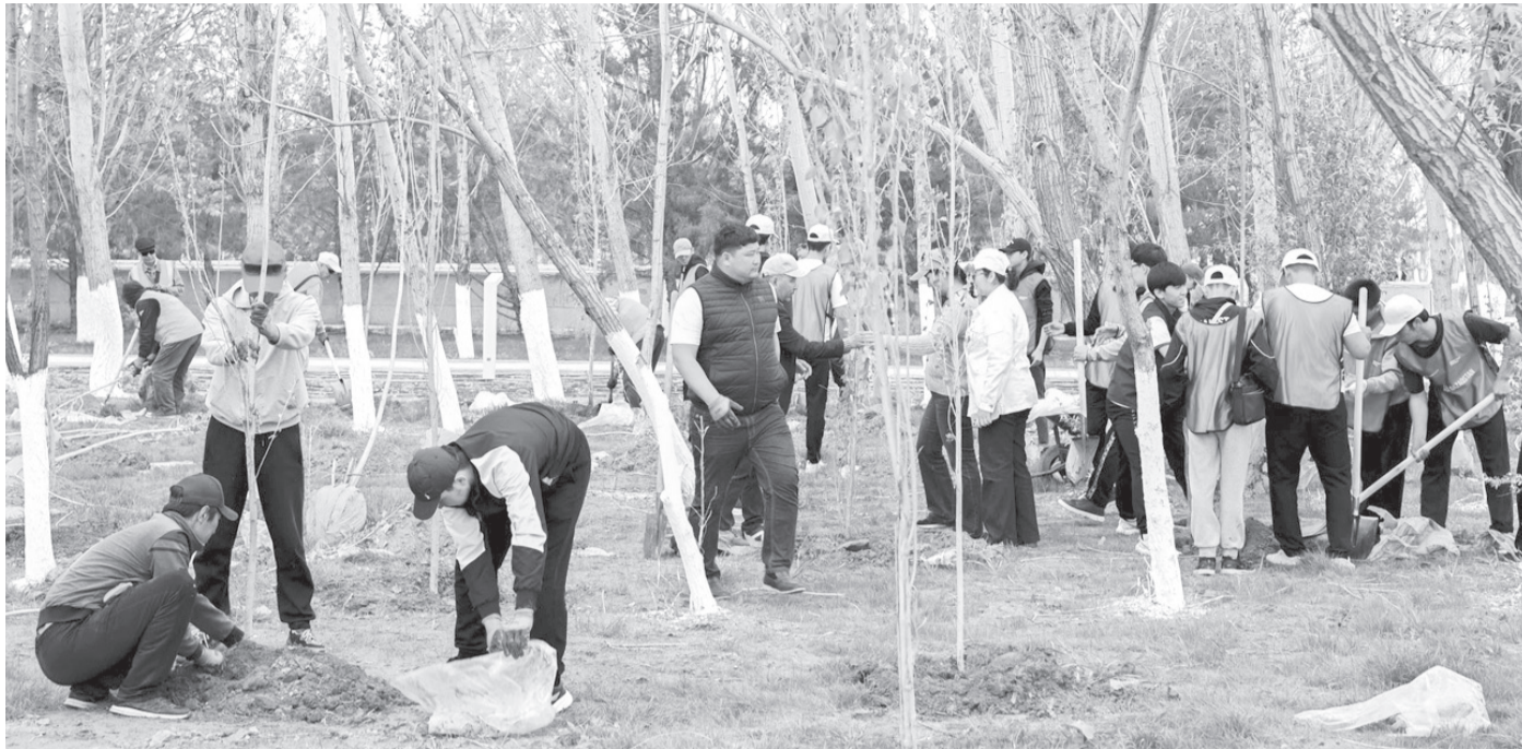
шығарылды, 250-ден астам техника жұмылдырылды.

Мемлекет басшысы «Таза Қазақстан» республикалық экологиялық акциясына қатысты. Қасым-Жомарт Тоқаев экobelсенділермен бірге елорданың «Самал» саябағында ағаш отырғызды. Президентке жауапты мемлекеттік орган басшылары атқарылған жұмыс жайында баяндады. Экология және табиғи ресурстар министрі Ерлан Нысанбаев «Таза Қазақстан» акциясы басталған екі жыл ішінде 1,5 мың экологиялық іс-шара ұйымдастырылғанын жеткізді. Осы уақыт аралығында 2 миллион тонна қоқыс жиналып, 5,5 миллионға жуық тал егілген. Жыл сайын бұл бастамаға 6,5 миллион адам, соның ішінде 780 мың волонтер қатысады. Министрдің айтуынша, 2021-2025 жылдары орман қорын толықтыру үшін 1 миллионнан аса гектарға 1 648,4 миллион түл көшет отырғызылған. Елді мекендерде бес жыл ішінде 18,4 миллион ағаш егілді. Алдағы уақытта 1 760 мың гектар жерді қамтитын 46 экоаумақ құрылады. Қызылорда қаласында жаңадан салынған Президент саябағындағы шараға облыс әкімі Нұрлыбек Нәлібаев, ардагерлер мен зиялы қауым өкілдері, құқық қорғау органдарының басшылары, облыстық және қалалық мәслихат депутаттары, облыстық басқарма, департамент, инспекция басшылары мен қызметкерлері, еріктілер, экobelсенділер, жастар ұйымдары және студенттер қатысты. Акцияға аймақтың аудандарынан, елді мекендерінен 25000 мыңнан астам адам атсалысып, 12 мыңнан астам тал егілді, 325,7 гектар аула тазартылып, 320 тоннадан астам қоқыс