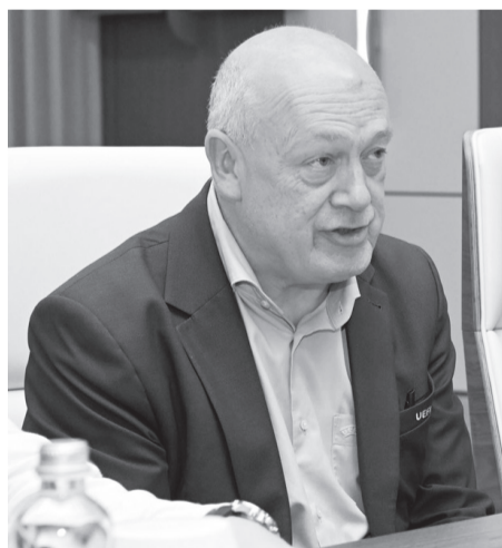
Кездесу барысында аймақта спорт саласын қолдау аясындағы