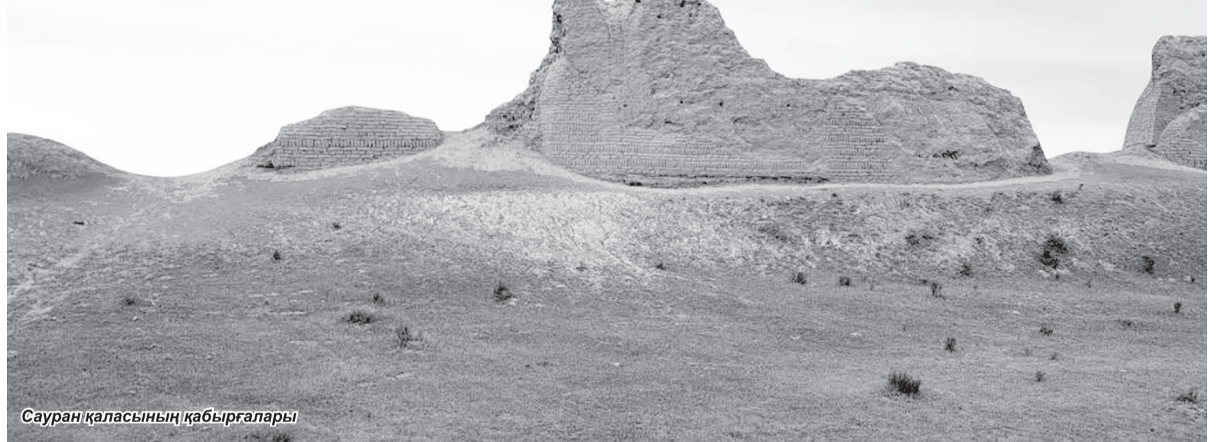
Сауран қаласының қабырғалары

Қазіргі Шыңжаң аумағындағы Такла-Макан шөлін айналып өтетін екі негізгі керуен жолы болды: бірі — Хами арқылы өтетін солтүстік бағыт, екіншісі — Тибеттің солтүстігіндегі таулы аймақтарды жағалай өтетін оңтүстік бағыт. Солтүстік жолмен жүргендер не Қашғарға бұрылып, кейін оңтүстік