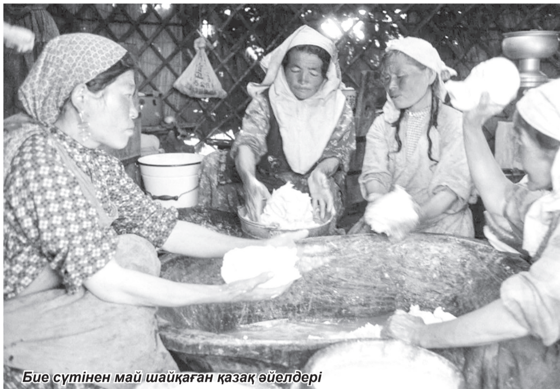
Бие сүтінен май шайқаған қазақ әйелдері

Мұны көктем кезінде адамға әртүрлі дәмнің, дәрумендердің қажет екенін ескеруден туған