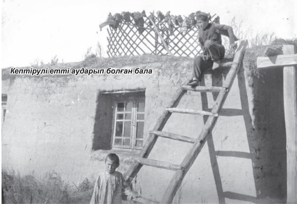
Кептірулі етті аударып болған бала

құбылыс деп түсіну керек. Өйткені көже — жеңіл, сіңімді және құнарлы сұйық тағам. Көженің осы қасиетін білген халық арасында төмендегі өлең жолдары кең тараған: